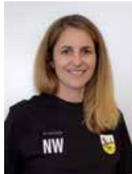
Sportferien für Kinder