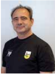
Präsident Philipp Pollems